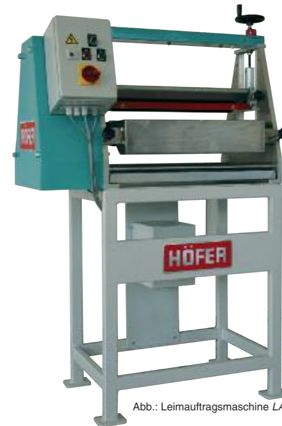
Abb.: Leimauftragsmaschine LAK