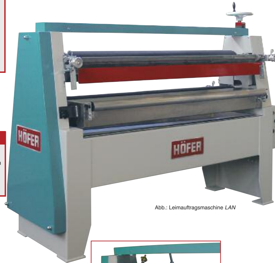
Abb.: Leimauftragsmaschine LAN

Überzeugend durch einfaches Handling. Exakte Leimdosierung mittels beidseitiger Spindeleinstellung der geschliffenen Abstreif rakel in Leimvorratswannen. Bequeme schnelle Handradhöhenverstellung und gut ablesbare Digitalanzeige für Werkstückdicken-einstellung.